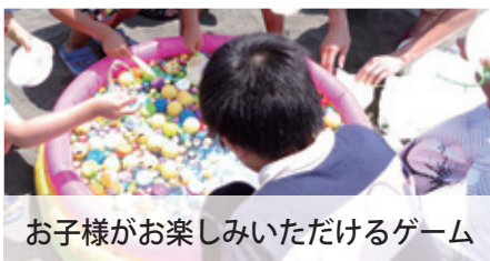
お子様がお楽しみいただけるゲーム