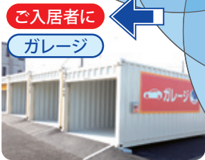
ご入居者に ガレージ