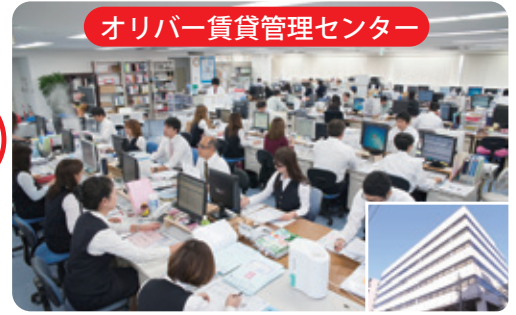
オリバー賃貸管理センター

[会社概要] 設立 1982年5月 グループ資本金 8,000万円 社員総数 200名