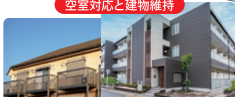
空室対応と建物維持