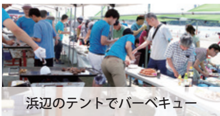
浜辺のテントでバーベキュー

今年もたくさんのオーナー様にご参加いただき楽しんでいただけるよう、新しい企画と合わせて今から準備を進めております。ご家族・ご友人とお誘い合わせのうえ是非ご参加ください。