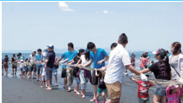
全員で力を合わせて魚を浜に引き上げます