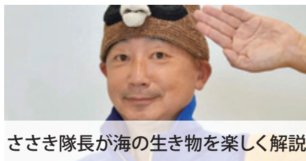
ささき隊長が海の生き物を楽しく解説