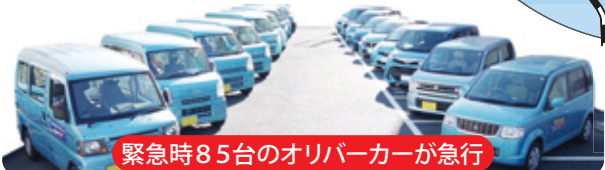
緊急時85台のオリバーカーが急行